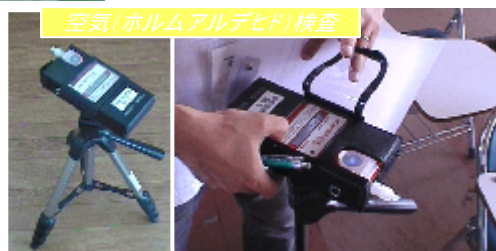
空気(ホルムアルデヒド)検査